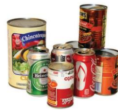
@5H5G, BOTT9L5S, : F5G7CG