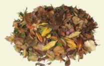
DESECHOS DE JARDÍN