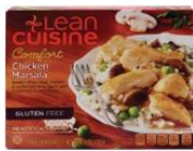
CONTENEDORES DE COMIDA CONGELADA / REFRIGERADA