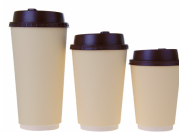
VASOS DE CAFÉ

Visite el sitio web para obtener información sobre el reciclaje de estos artículos: