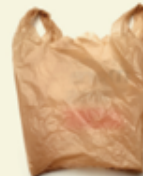
BOLSAS DE PLÁSTICO