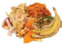
RESTOS DE COMIDA